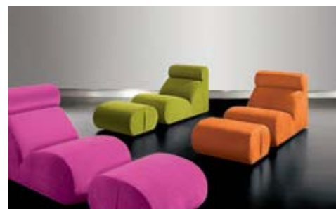
Art. 13 Pouf Pouf Pouf