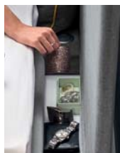
Portagioie p. 376 Jewelry Box - Porte-bijoux

Le double rembourrage de la grande tête de lit et des coussins indépendants. Un choix de design mais aussi un choix de confort.