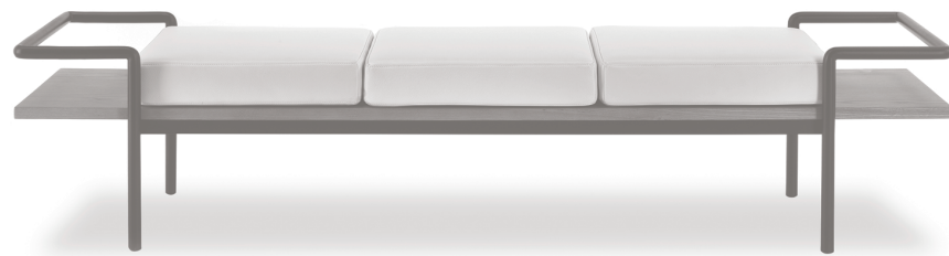
Icone Poltrona Frau Icons

T 904 nasce come tavolino trasportabile con maniglie e dotato di cuscini per un uso parallelo come seduta. Si caratterizza come un arredo che, nel tratto pulito e nell'uso del tubolare, riassume il design anni '50 con una sua originalità.