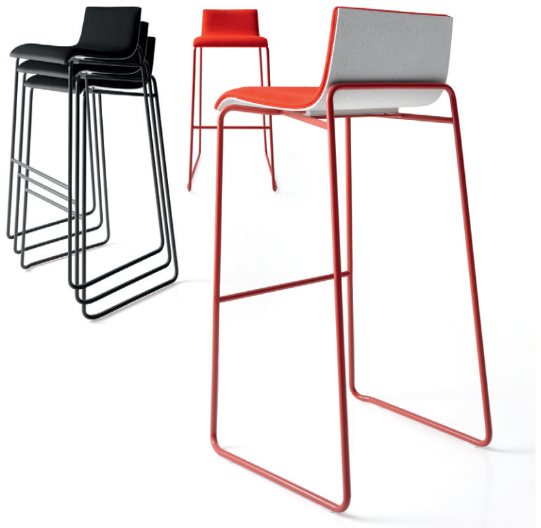
2574 BW - 2590 BW

Sgabello impilabile con struttura in metallo cromato, scocca in faggio o rovere, naturale, tinto o laccato opaco.