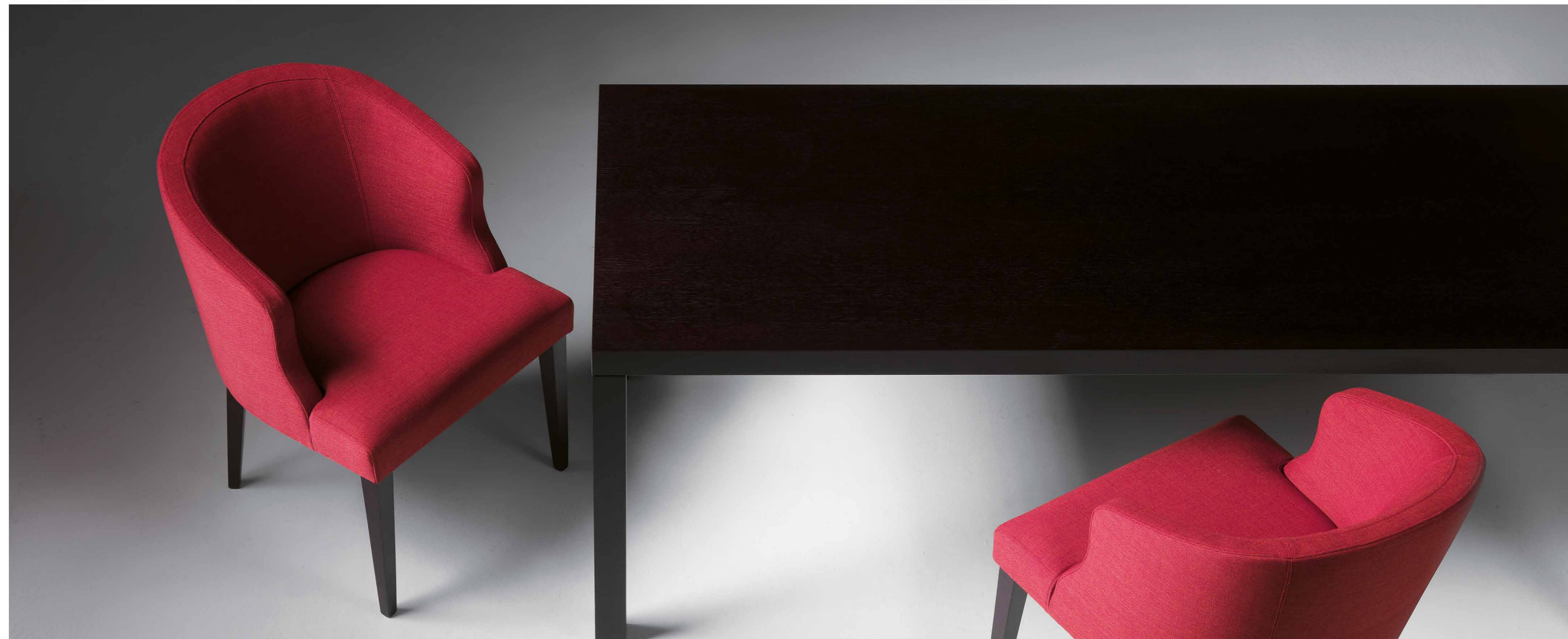
Becky è una serie di sedie e poltroncine caratterizzata da dei rivestimenti semplici oppure trapuntati a seconda del gusto del cliente. Spiritoso è il bottone al centro dello schienale della sedia che è offerto come optional. Becky is a collection of armchairs and chairs upholstered with a simple or quilted cover. Nice is the button in the centre of the backrest which is offered as an option.