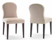
Chair L46 P56 H85 9BK102