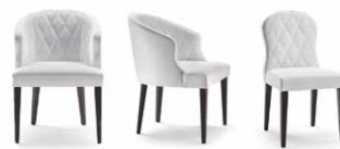
Quilted armchair L59 P66 H85 9BK104