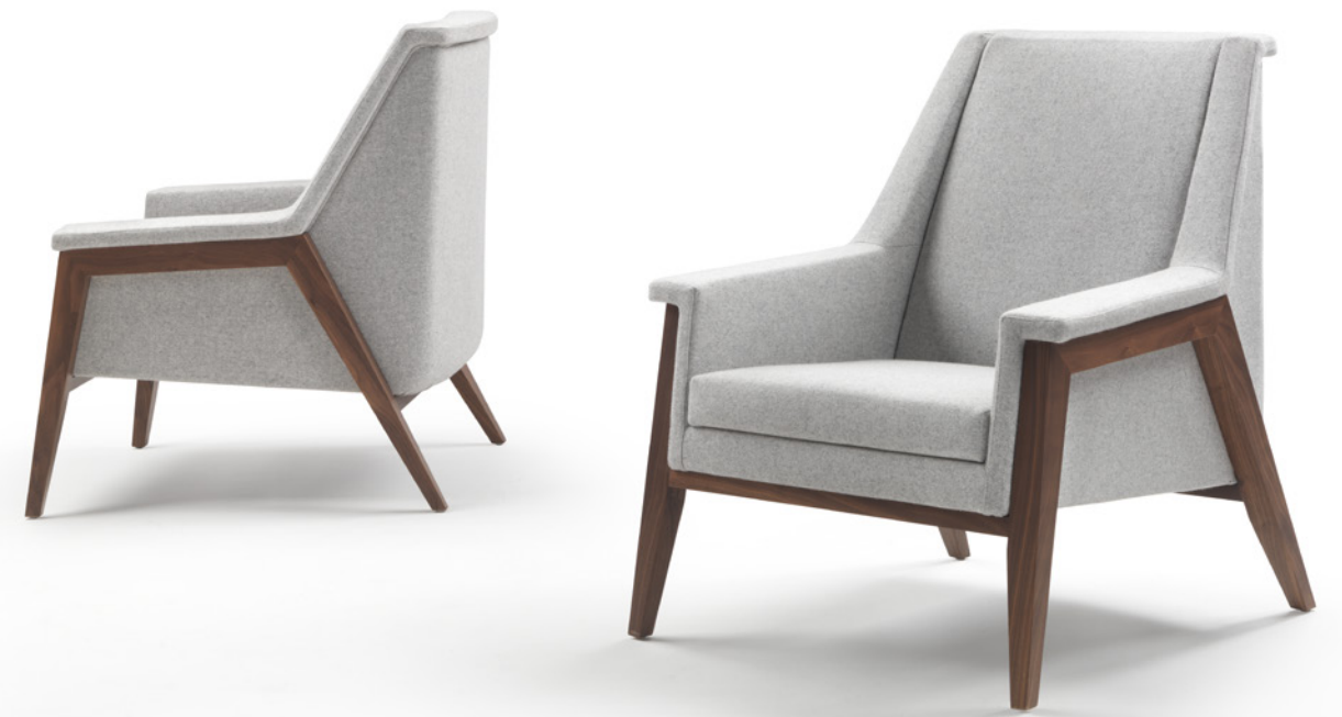
Poltrona MORRIS 9MR101 cm 83x90x95h in tessuto di Camira cat. E art. Blazer col. Silverdale col. CUZ28 con struttura in noce Canaletto massello. MORRIS armchair 9MR101 cm 83x90x95h in Camira fabric cat. E art. Blazer col. Silverdale col. CUZ28 with solid Canaletto walnut structure.