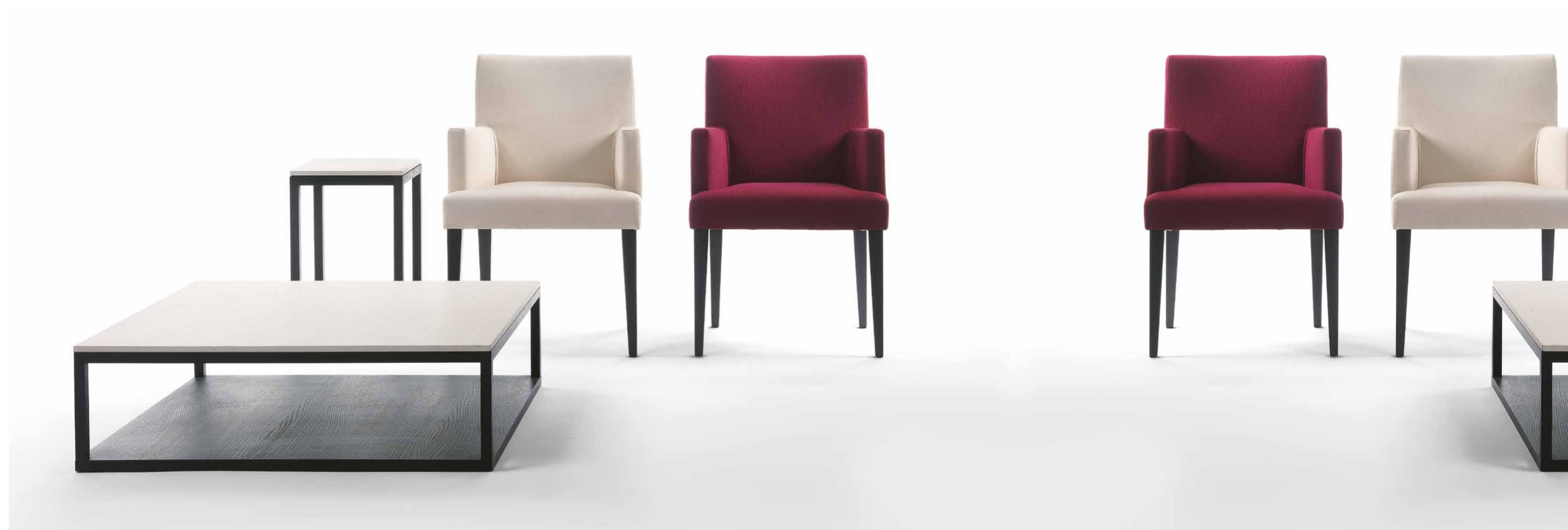
Vicky è una serie di sedie e poltroncine caratterizzata da dei rivestimenti semplici oppure trapuntati a seconda del gusto del cliente. Vicky is a collection of armchairs and chairs upholstered with a simple or quilted cover.