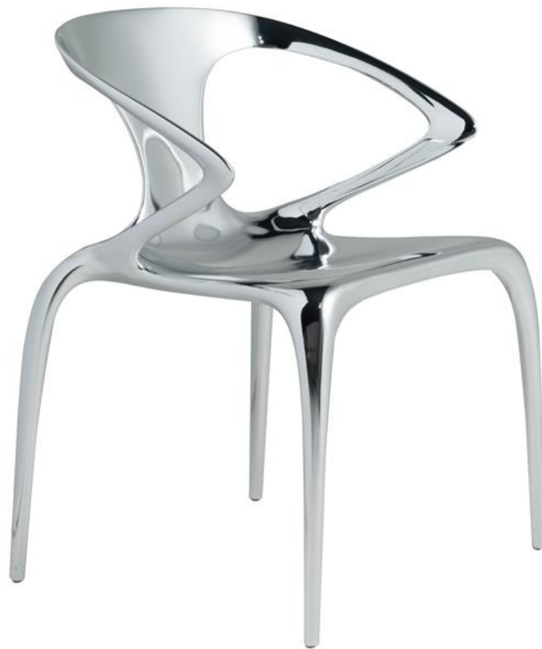
Chaise - Chair - Sillòn