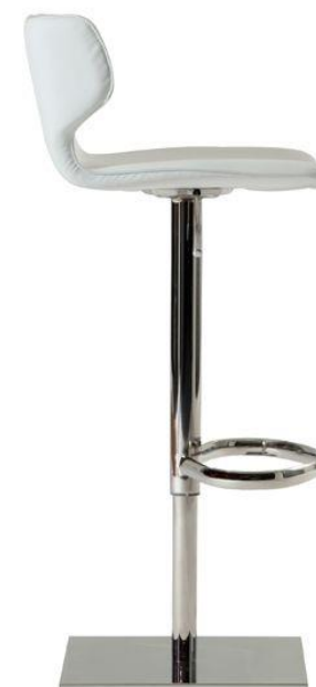
Tabouret – Stool – Taburete