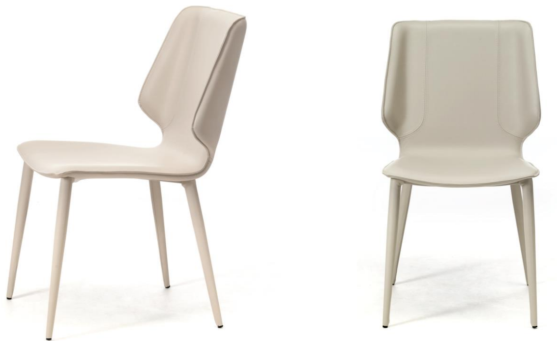
Chaise – Chair – Silla