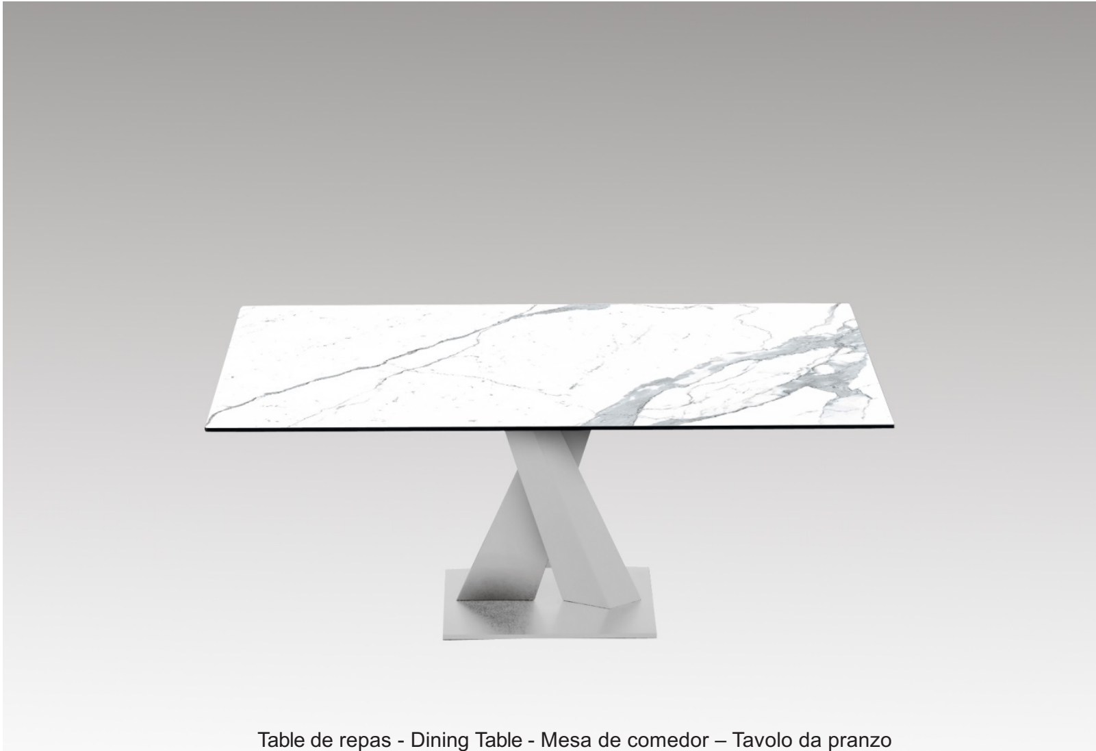
Table de repas - Dining Table - Mesa de comedor – Tavolo da pranzo