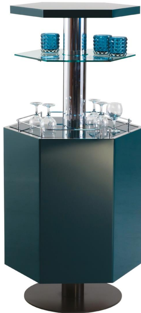
Colonne bar - Bar column - Columna bar