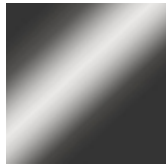
verniciato grigio scuro