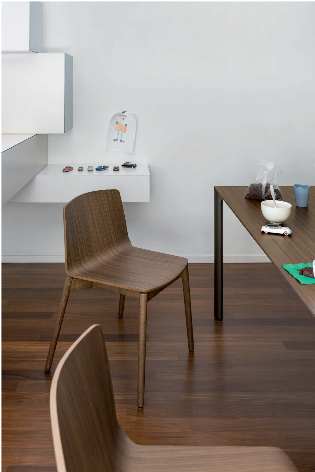
Rama Wood chair Wooden body