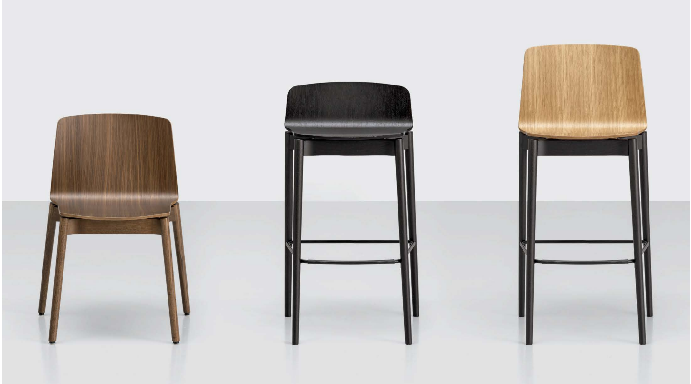
Rama Wood chair Wooden body