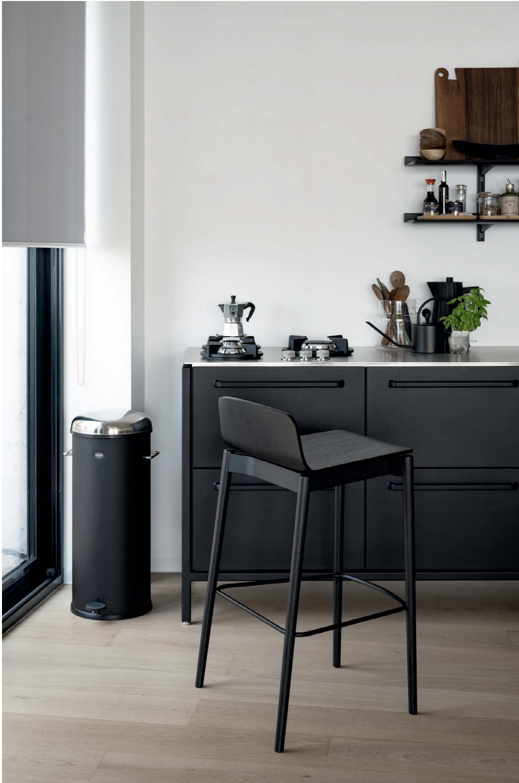
Rama Wood stool Low wooden back