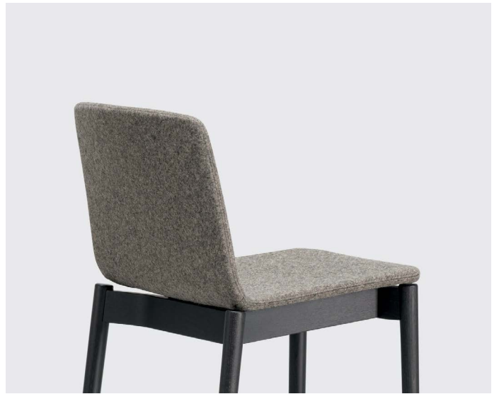
Fully upholstered version