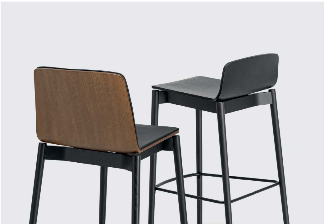
High back front-face upholstered and low wooden back