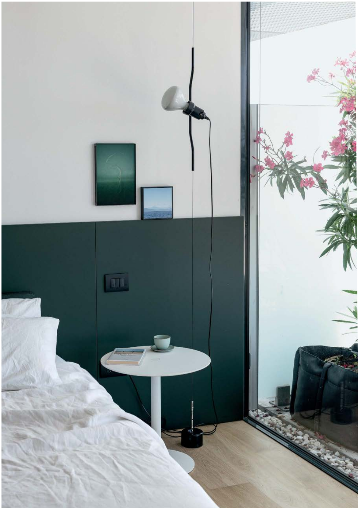
PTB (Push the Button) occasional table Fenix-NTM® top