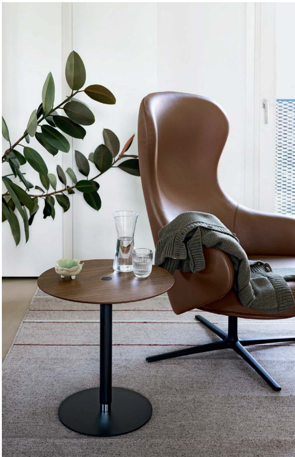
PTB (Push the Button) occasional table Wooden top