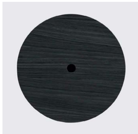
Black oak top