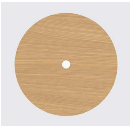
European oak top