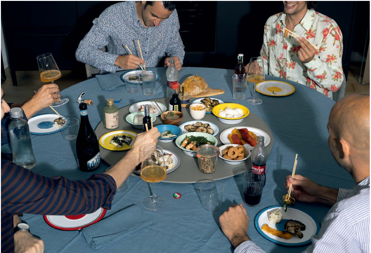
Lazy Susan (rotating tray) Aluminium